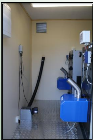
Fastbränslepannor 2 st Ariterm 360

20 fots container med färdig dragen el & vvs, värmeväxlare 100 kw för anslutning till kulvert.