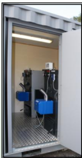
Pelletsbrännare 2 st Swebo PB50